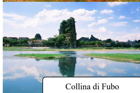
Collina di Fubo